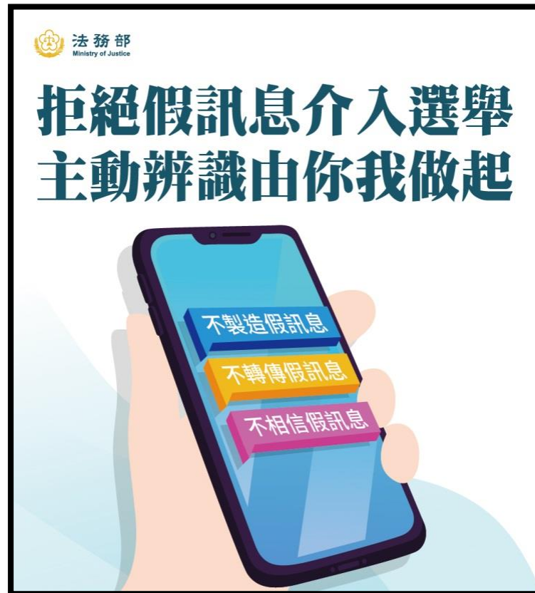
法務部宣導圖卡：直式橫式各一